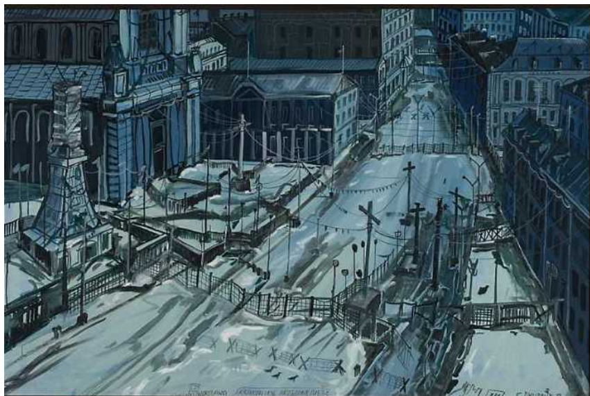
Edward Dwurnik, Krakowskie Przedmieście II , 1982

Przeczytaj cytaty opisujące twórczość Edwarda Dwurnika.