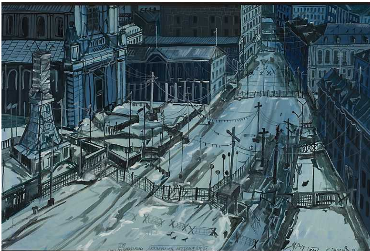
Edward Dwurnik, Krakowskie Przedmieście II , 1982