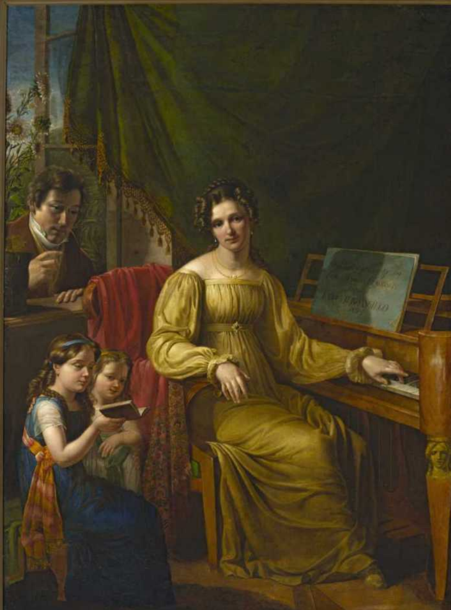
Antoni Blank, Autoportre z rodziną , 1825