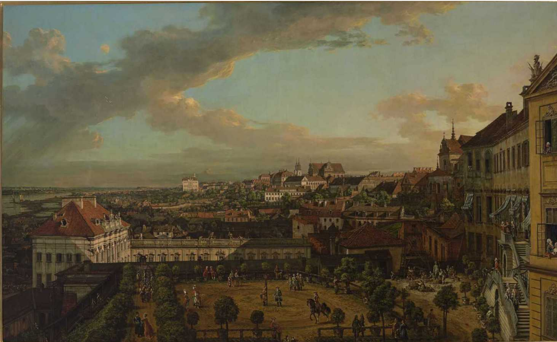
Bernardo Bellotto zwany Canaletto (1721-1780), Widok Warszawy z tarasu Zamku Królewskiego, 1771

Jak wyglądałyby ten obraz bez namalowanych ludzi?