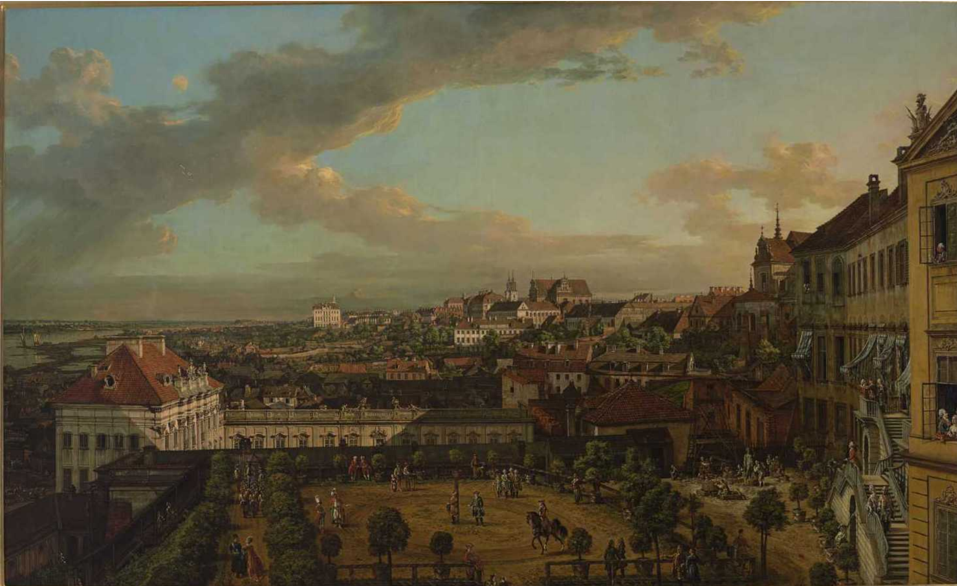
Bernardo Bellotto zwany Canaletto (1721-1780), Widok Warszawy z tarasu Zamku Królewskiego, 1771