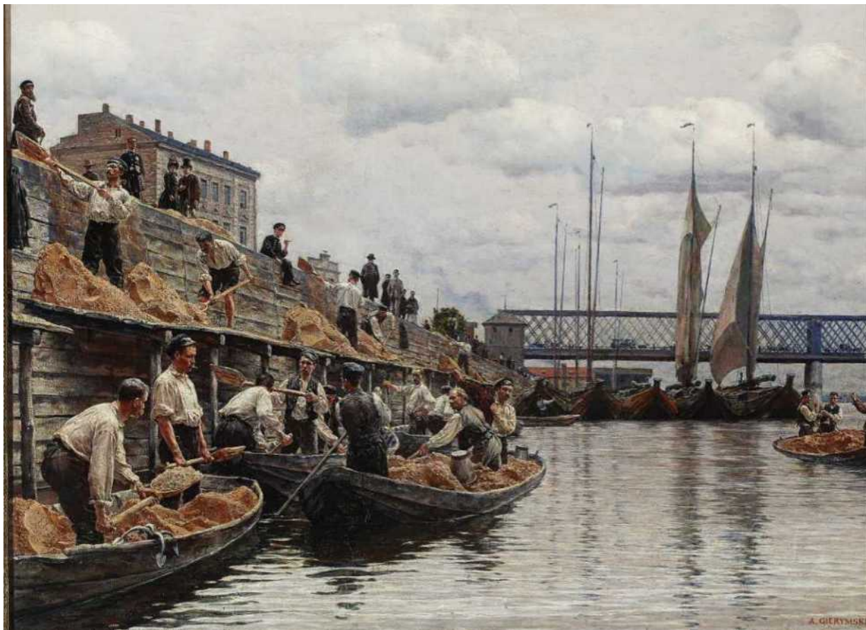
Aleksander Gierymski, Piaskarze , 1887