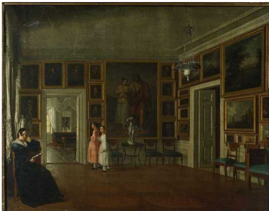
Aleksander Kokular, Wnętrze salonu w domu artysty , ok. 1830

Jaka była Twoja odpowiedź na pytanie do kogo należało to mieszkanie?