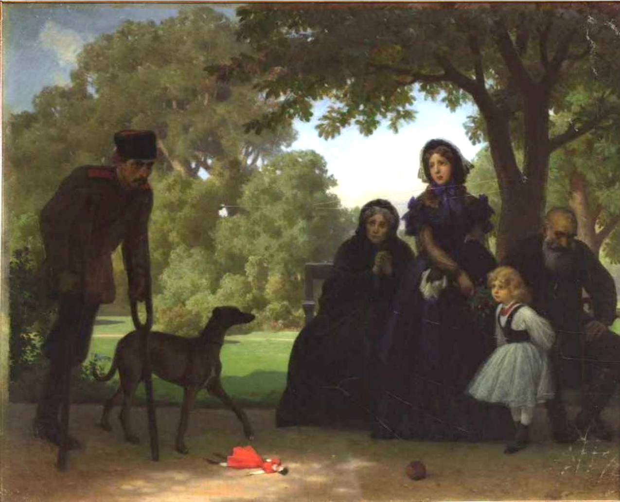
Artur Grottger, W Ogródzie Saskim , 1863

Artur Grottger (1837–1867) przedstawiciel romantyzmu w malarstwie, ukazywał tragedię narodu poprzez przedstawianie wydarzeń jednostkowych i anonimowych bohaterów. Ważnym elementem prac jest czytelnie zarysowany emocjonalny wymiar zdarzeń. Dramaturgia jego obrazów, opiera się na ekspresji uczuć bohaterów. Artysta łączył perfekcyjny iluzjonizm malarski z psychologiczną analizą postaci.