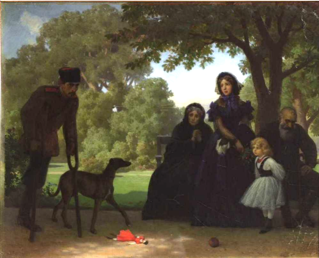
Artur Grottger, W Ogrodzie Saskim, 1863

Po opisaniu sceny przejdź do interpretacji. Przyjrzyj się przedmiotom i postaciom, ich gestom oraz wyrazom twarzy? Jak reagują na spotkanie w parku?