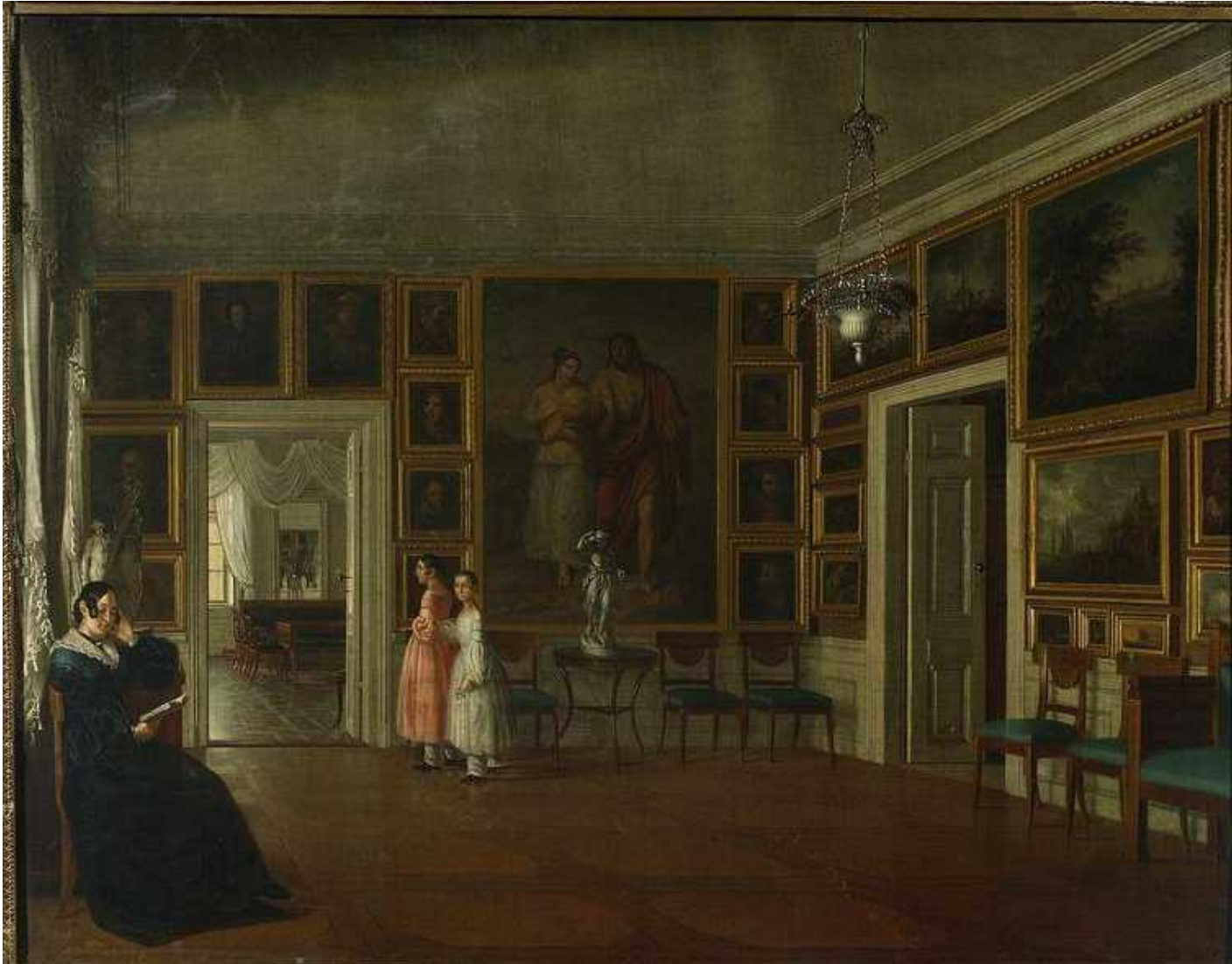
Aleksander Kokular, Wnętrze salonu , ok. 1830